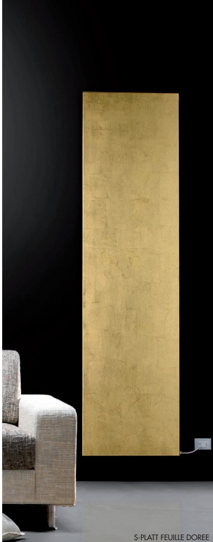
S-PLATT FEUILLE DOREE