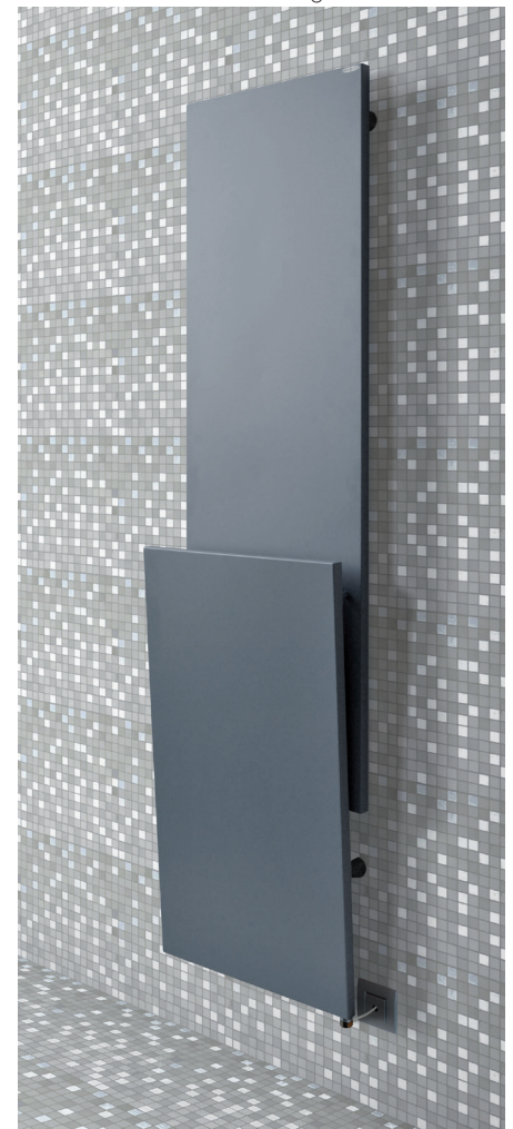
SLIDE 53-123 SLIDE 53-163